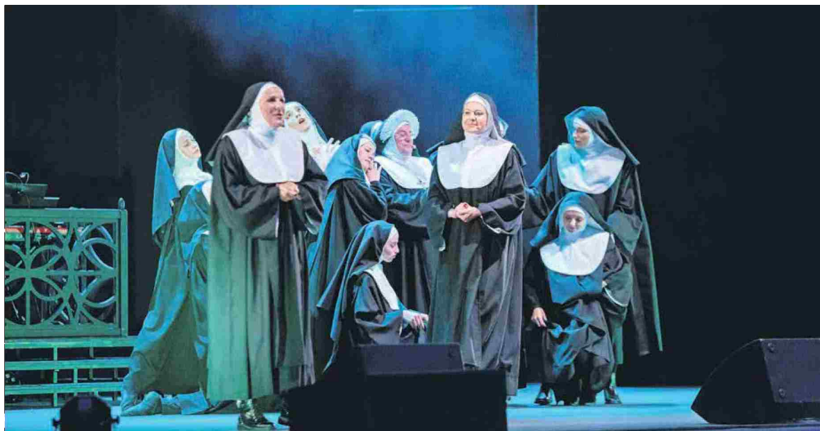
Nune v akciji!