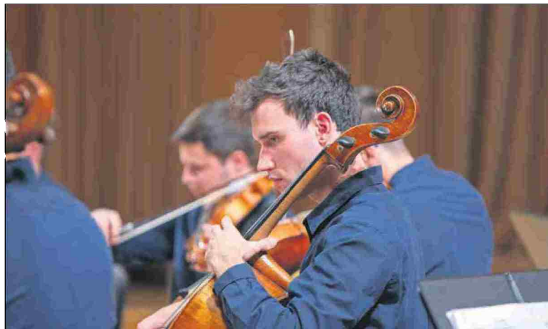
Komorni orkester Anima Musicae